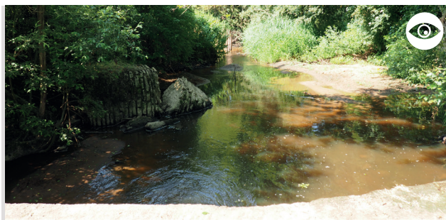
GUÉ DE L'ODRACHE