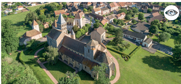
L'ÉGLISE SAINT-PIERRE ET SAINT-BENOIT, SON PRIEURÉ ET SON PARC