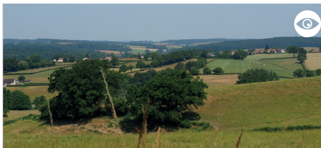
VUE SUR LE MORVAN DEPUIS CHAMPCROUX