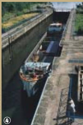
Ecluse du Pont Malin.

est un petit « chemin d'eau », au dimension d'un canal Freycinet, c'est-à-dire 38 m de long et 5 m de large. Ici moins de marchandises à transporter et place au tourisme fluvial. Le Bassin-Rond est le port de plaisance de Bouchain. Des croisières, à bord de péniches, le long de l'Escaut et de la Sensée remportent un vif succès. Le secteur attire aussi les passionnés de pêche et de nombreux efforts sont entrepris pour sauvegarder le patrimoine et mettre en valeur le paysage. Mais attention n'est pas batelier qui veut et si l'idée de vivre au fil de l'eau paraît séduisante, elle n'en est pas moins contraignante : vivre en nomade ; savoir se débrouiller pour tout réparer ; le coût de la péniche et le permis rivière, sont les conditions à remplir avant de vivre la grande vie sur l'eau. Un petit bateau de tourisme en location ferait peut-être bien l'affaire pour commencer !