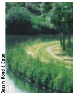
Bassin Rond à Etrun.

Circuit familial le long des canaux et des marais de la Sensée. L'itinéraire est sans difficulté. En période de chasse, suivre la variante décrite au verso. L'identification des plantes des milieux humides et des oiseaux d'eau, l'observation des bateaux de plaisance et des péniches sont autant d'activités à pratiquer au cours de la balade.