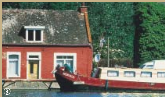
Bassin Rond à Etrun.

L'Escaut prend sa source à Gouy dans l'Aisne et se jette dans l'estuaire d'Anvers, après avoir effectué plus de 350 km à travers la Picardie, le Nord-Pas-de-Calais, la Wallonie et la Flandre. Participent à ce voyage de nombreux affluents, parmi lesquels la Sensée qui