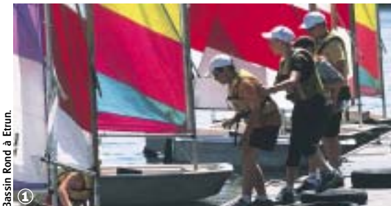
Bassin Rond à Etrun.

Escaut et Sensée, deux vallées aux sources du Hainaut