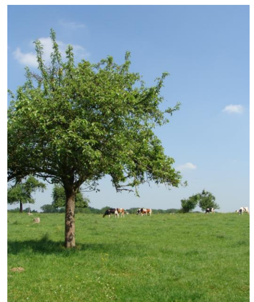
Le bocage à Potelle