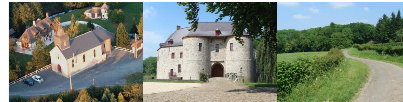
La chapelle ND des Sept Douleurs à Villereau-Herbignies